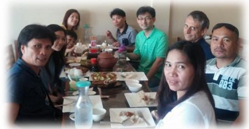
이전 세미나에 참석한 만다야 목회자들

하나님의 자비와 은혜를 더 잘 이해하고, 마음으로 받아들이기 시작할때, 성령 하나님의 역사가 일어나는 것을 보게 됩니다. 하나님께서 알게해주시고 만나게 해주신 이들로 인해 주님께 영광을 돌립니다!