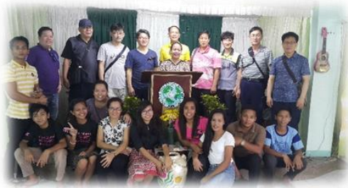
친교회 목사님들과 함께 교회들 방문