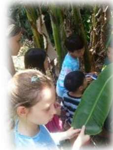
선교사 아이들 .. 우와! 즐거운 식사와 놀이

부족 선교 뿐만 아니라 도시의 현지 교회들 안에도 많은 필요들이 있습니다. 그 중 하나는 바로 목회자들의 재교육입니다. 열악한 환경 가운데에서 있는 목회자들에게 하나님 말씀을 더욱 잘 이해할 수 있도록 도와주는 것이 우선적으로 필요한 과제가 아닌가 합니다. 말씀으로 변화받은 이들이 자발적으로 부족 사역에 직간접적으로 동참하게 된다면, 사역의 열매가 더욱 풍성하게 될 것입니다. 참으로 감사한 것은 친교회 목사님들께서 이 사역에 귀히 동참하여 주신다는 것입니다. 섬기시는 모습을 통해 이곳 선교사, 현지 목회자들에게 큰 격려와 위로가 됩니다. 주님의 나라가 이러한 사랑의 협력을 통해 이루어져가는 구나!라는 깨달음도 가지게 됩니다.