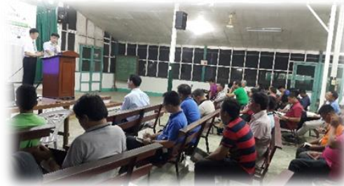
엠마오 캠프, 저녁 집회 말씀을 통역하며..