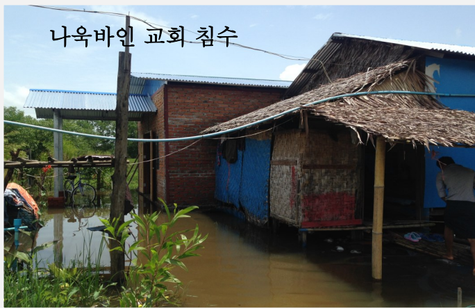
나옥바인 교회 침수