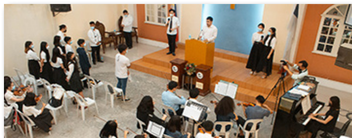
온라인 청소년 집회

6. 로고스 성서침례교회 다음 세대 사역의 일환으로 온라인 청소년 집회를 6월12일에 열었으며, 6월20일에는 창립 32주년 예배를 드렸습니다. 이 날, 신실하신 하나님의 은혜에 감사한 마음으로 계속해서 주님의 말씀을 세상에 선포하는 교회가 되겠다는 헌신을 하였습니다.