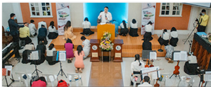
창립 32주년 예배